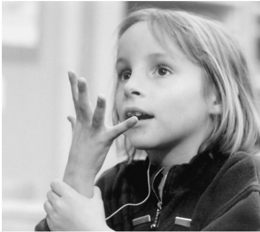
Tanz der Hände: gebärdendes Mädchen an der Genfer Gehörlosenschule «Montbrillant».

Dass Sprache nicht ausschliesslich in lautlicher Form anzutreffen und auch nicht an ein Material gebunden sei, stellt schon der sowjetrussische Sprachforscher L.S. Wygotski in seinem 1934 erschienenen Werk Denken und Sprechen fest, und er verweist in diesem Zusammenhang auf die «optische Sprache» der