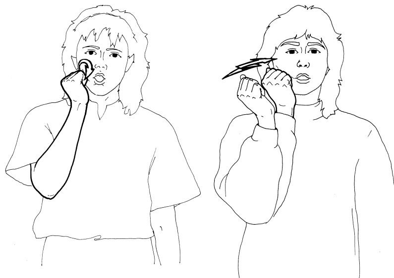
Linguistisches Minimalpaar: Die Gebärden ROT (links) und MAMA (rechts) unterscheiden sich nur durch die Komponente Bewegung – Handform, Handstellung und Ausführungsstelle sind identisch.

Zu einer «Imageverbesserung» haben sicher auch die Medien beigetragen. Gehörlosigkeit ist in den letzten Jahren vermehrt ins Bewusstsein der Hörenden gerückt. Neben wichtigen Spiel- und