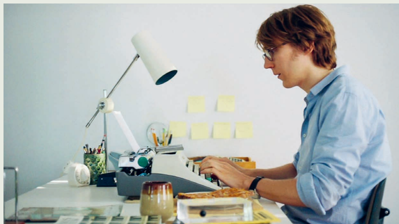
Ruby Sparks (2012) Regie: Jonathan Dayton und Valerie Faris