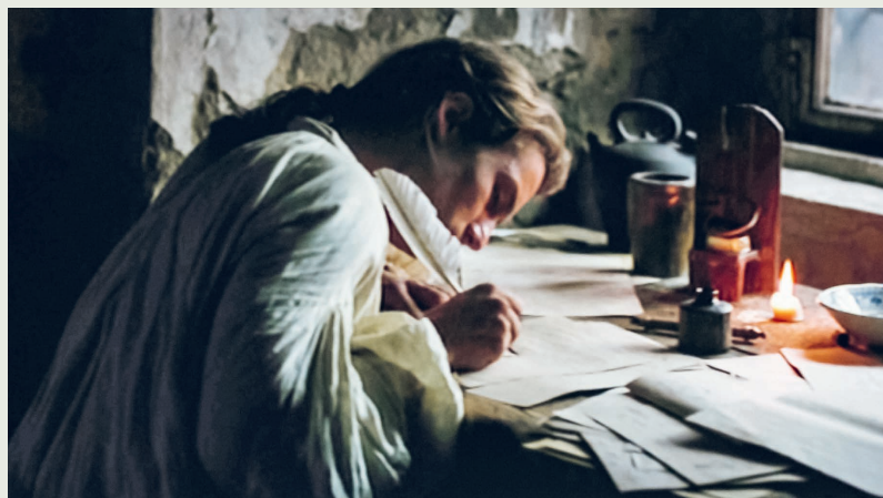
Goethe! (2013) Regie: Philipp Stölzl